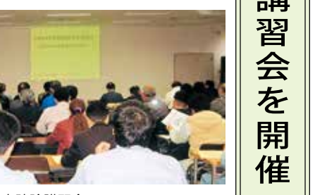
病害虫防除講習会

協会と神奈川県農業技術センター病害虫防除部・神奈川県植木連合会と共催で平成二十四年度第二回病害虫防除関係者講習会が二月一日「平塚合同庁舎五階会議室に於いて実施され総勢七十一名(造園業関係二十二名・行政六名・農協等四十一名)が参加しました。